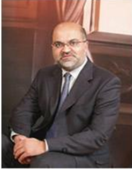
قوة الخبرة الحقيقية The Power of Real Expertise